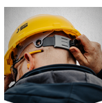
Fácil de ajustar

Apertar ou soltar facilmente o ajuste do capacete graças à catraca da roda na parte traseira.