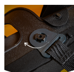
Correia de queixo amovível