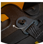
Tali dagu yang dapat dilepas