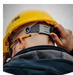
Facile à ajuster

Serrez ou desserrez facilement l'ajustement du casque grâce au cliquet de roue à l'arrière.